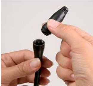
Легкая замена сенсора пользователем