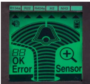
Постоянная диагностика состояния сенсора