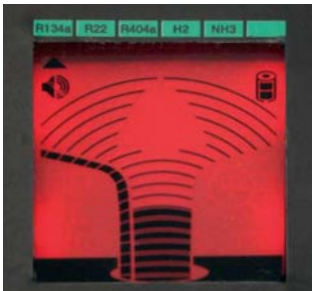
Индикатор максимума отображает максимум утечки

testo 316-4 Set 1 быстрый и надежный детектор утечек для всех стандартных хладагентов