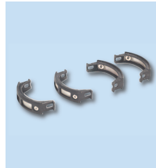
Защита от насекомых