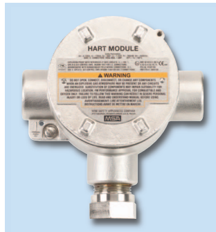
Соединительная коробка HART