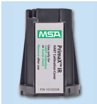
Калибровочная крышка при работе с HART