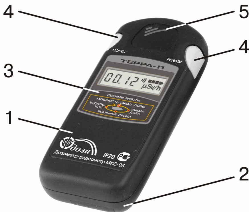
Рисунок 1.1 - Общий вид дозиметра

Корпус дозиметра (рисунки 1.1, 1.2) состоит из верхней (1) и нижней (2) крышек. В средней части верхней крышки (1) дозиметра расположена панель индикации (3), слева и справа над ней – две клавиши (4) управления работой дозиметра, а в верхней части крышки (1) – громкоговоритель (5).